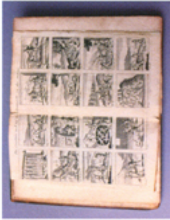
93. Bartolomé de las Casas, A Revelation of the First Voyages and Discoveries Made by the Spaniards in America , 1699