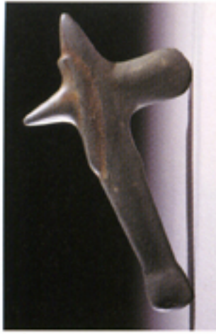
94. Taíno culture, Ceremonial Ax , A.D. 1200-1500